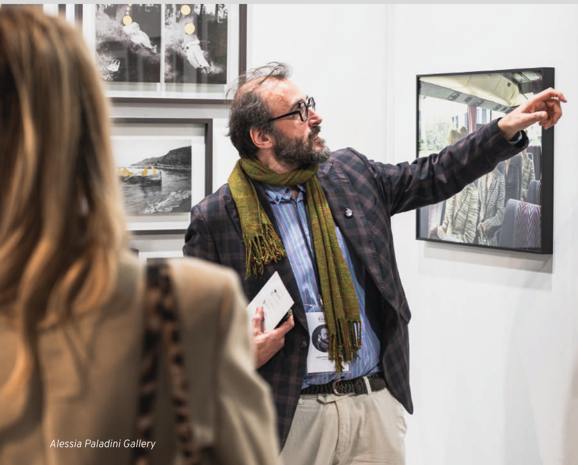
Alessia Paladini Gallery

The Phair propone inoltre un programma di ospitalità rivolto a collezionisti selezionati e indicati dagli Espositori.