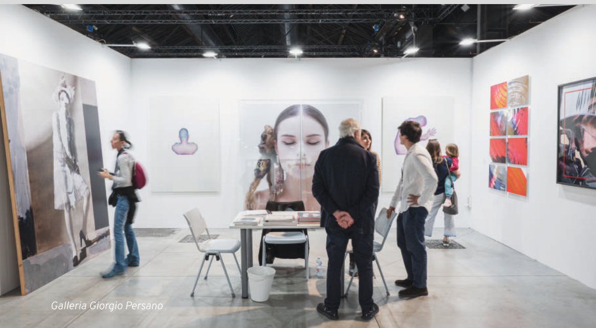
Galleria Giorgio Persano

Una manifestazione di dimensioni contenute per garantire un'elevata qualità della proposta espositiva e una fruizione delle opere curata, intima ed elegante. La selezione delle proposte artistiche delle gallerie coinvolte è affidata a un Comitato composto da professionisti di diversi settori del mondo dell'arte così da garantire una prospettiva completa nella valutazione dei progetti.